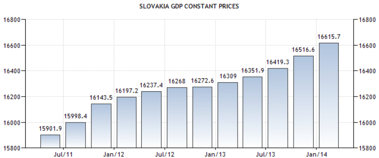
Figure 1. Lorem ipsum dolor sit amet, consectetur adipiscing elit

dictum. Nulla facilisi. Mauris luctus neque ultrices augue placerat, at imperdiet justo pellentesque. Phasellus convallis sapien ac sem iaculis, et mollis ex tristique. Mauris pretium semper libero, vel feugiat neque ullamcorper ac. Ut non ultrices libero.